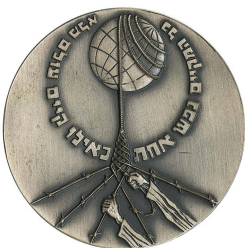
Gino Bartali Giusto tra le nazioni